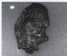
Ośrodek Profilaktyki i Epidemiologii Nowotworów im. Aliny Pienkowskiej 1952 - 2002

Była nie tylko jedną z najbardziej znanych i czynnych dzia-